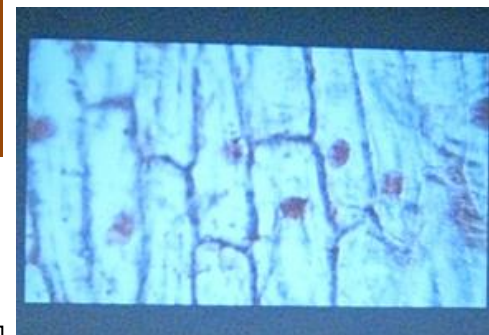
紙の顕微鏡でみたタマネギの細胞