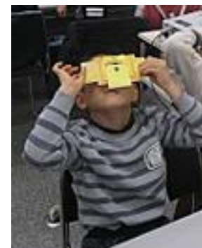
目に当てて観察します